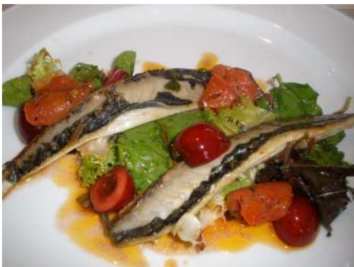
esta ensalada de caballa (justa cocción) con escabeche de cerezas y