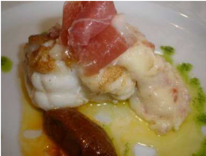
el excelente rape con puré al Jabugo y quenelle de sofrito,