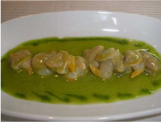
los berberechos con albahaca (algo aceitosos),