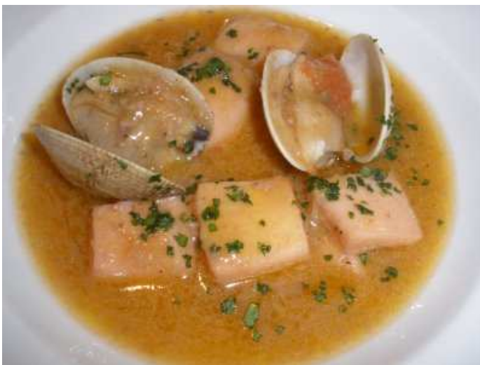
el tradicional guiso de patata y sepia (me gusta que la sepia esté algo más tersa) y sobretodo, isobretodo!